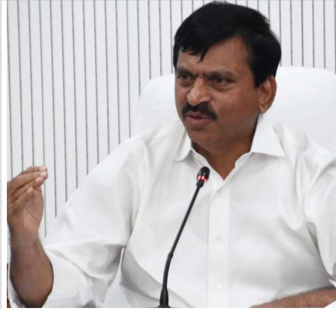
కూల్చిన అంశంపై అర్జులైన పేదలకు ఇందిరమ్మ ప్రభుత్వంలో ఇటు కట్టి ఇస్తుందన్నారు.