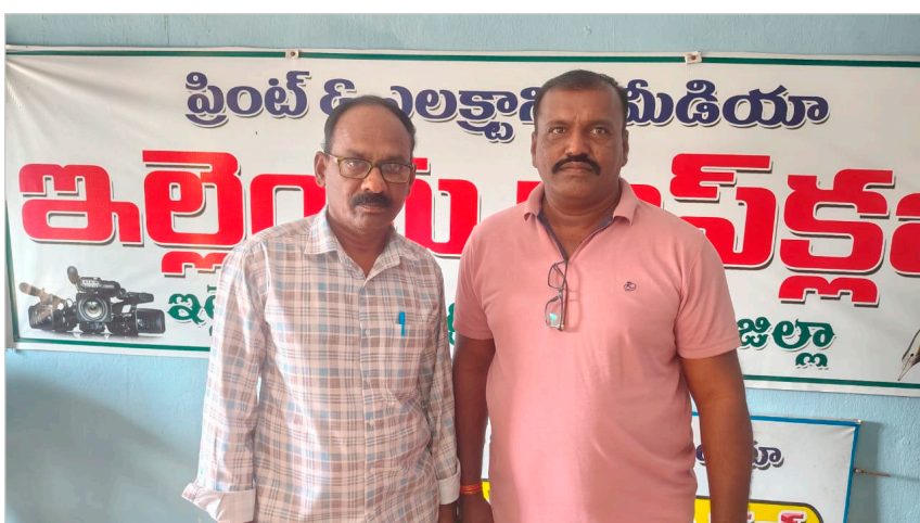
కార్యకలాపాలు మరింత మరుకుగా సాగాలని ఆశాంక్షించారు. ఇల్లందు ప్రాంతంలో పత్రికారంగానికి విశిష్ట గుర్తింపు తీసుకురావడంలో ఈ నూతన కమిటీ కీలక పాత్ర పోషిస్తుందనే ఆశాభావం వ్యక్తమవుతోంది.