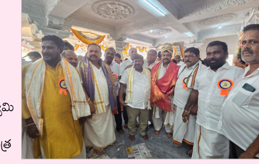
కూకట్ పల్లి నియోజకవర్గం, జగద్గిరిగుట్టలోని వెంకటేశ్వర నగర్లో కొలువుదీరిన శ్రీ అభయంజనేయ స్వామి సమేత కోడండరామ స్వామి ఆలయంలో నూతన శిలామయ ఆలయ యంత్ర మూలవిరూప్, గోదాదేవి,

హైదరాబాద్, కుత్బుల్లాపూర్ ప్రతినిధి అంజిబాబు, ఫిబ్రవరి 26, (జన సంఘర్షణ):