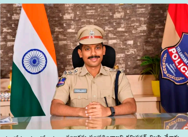
నిజామాబాద్ పోలీస్ కంట్రోల్ రూమ్ లో ఉన్న పోలీస్ అధికారి.

చేస్తూ నిజామాబాద్ లో ఈ సేవలను అందుబాటులోకి తీసుకువచ్చారు. గల్వ దేశాల్లో ఉన్న వారి భద్రత, స్థితిగతులపై సమాచారం పొందడానికి కుటుంబ సభ్యులు వెంటనే కంట్రోల్ రూమ్ను సంప్రదించాలని సూచించారు. సంప్రదించవలసిన సంఖ్య: నిజామాబాద్ పోలీస్ కంట్రోల్ రూమ్: 8712659700, సర్కిల్ ఇన్స్పెక్టర్: 8712659821. ప్రజలు అపోహలు నమ్మకుండా అధికారిక సమాచారం కోసం మాత్రమే ఈ సంఖ్యను సంప్రదించాలని కమిషనర్ విజ్ఞప్తి చేశారు.