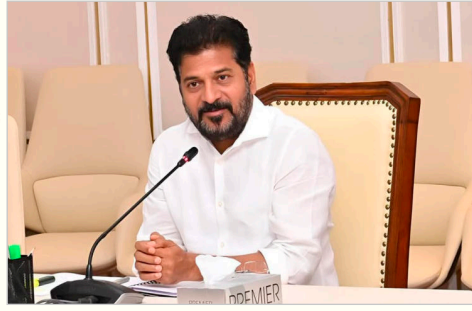
మధ్యప్రాచ్య (పశ్చిమ ఆసియా) దేశాల్లో నెలకొన్న పరిస్థితుల నేపథ్యంలో తెలంగాణ ప్రభుత్వం అప్రమత్తమైంది.