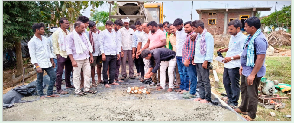
ఎల్లారెడ్డి మార్చి 18 (జన సంఘర్షణ)