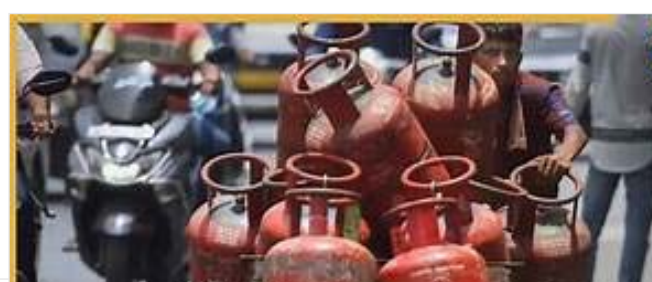
మిగతా 2వ పేజీలో..

న్యూఢిల్లీ జన సంఘర్షణ దేశవ్యాప్తంగా నెలకొన్న వాణిజ్య గ్యాస్ కొరతను అధిగమించేందుకు కేంద్ర ప్రభుత్వం సత్వర చర్యలు చేపట్టింది.