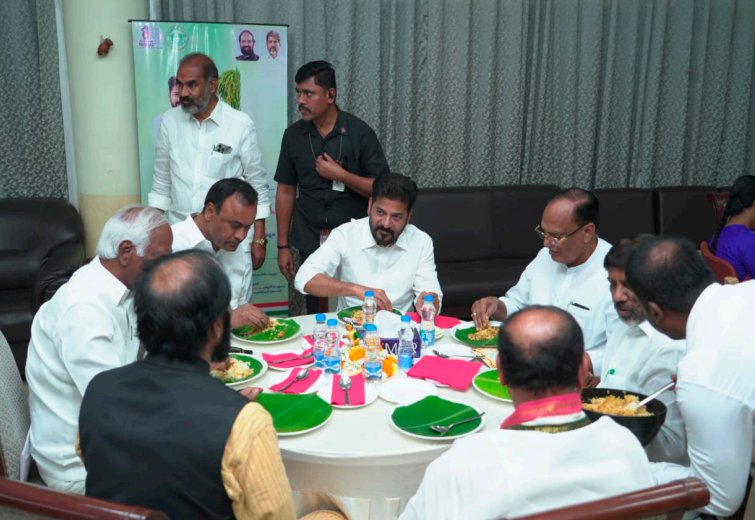
కుమార్ రెడ్డితో పాటు మంత్రులు, ఎమ్మెల్యేలు, ఎమ్మెల్యేలు పాల్గొని భోజనం చేశారు. ఈ సందర్భంగా

తెలంగాణ/హార్వీ 30/జన సంఘర్షణ ఆహార కల్తీని నియంత్రించడానికి రాష్ట్రంలో ఒక ప్రత్యేక వ్యవస్థను తీసుకొస్తామని ముఖ్యమంత్రి ఎ. రేవంత్ రెడ్డి తెలిపారు. ప్రస్తుతం రాష్ట్రంలో కొత్తగా తీసుకొచ్చిన ఈజిల్, హైద్రా తరహాలోనే ఆహార కల్తీని నియంత్రించడానికి కూడా ప్రత్యేక వ్యవస్థను ఏర్పాటు చేస్తామన్నారు. ఇందుకోసం దేశంలో ప్రస్తుతం అమలువుతున్న కల్తీ నిరోధక చట్టాలను అధ్యయనం చేసి వటిప్రకారం చర్యలు చేపడతామని చెప్పారు. రాష్ట్రంలో 3.39 కోట్ల మందికి పంపిణీ చేస్తున్న సన్నాచియ్యం పథకం ప్రారంభమై ఏడాది పూర్తయిన సందర్భంగా పౌర సరఫరాల శాఖ అధ్యక్షులతో ప్రజాప్రతినిధులకు శాసనసభ సెంట్రల్ హాలులో సన్నాచియ్యంతో భోజనం ఏర్పాటు చేశారు. ముఖ్యమంత్రితో పాటు మండలి చైర్మన్ గుత్తా సుఖేందర్ రెడ్డి, స్పీకర్ గడ్డం ప్రసాద్