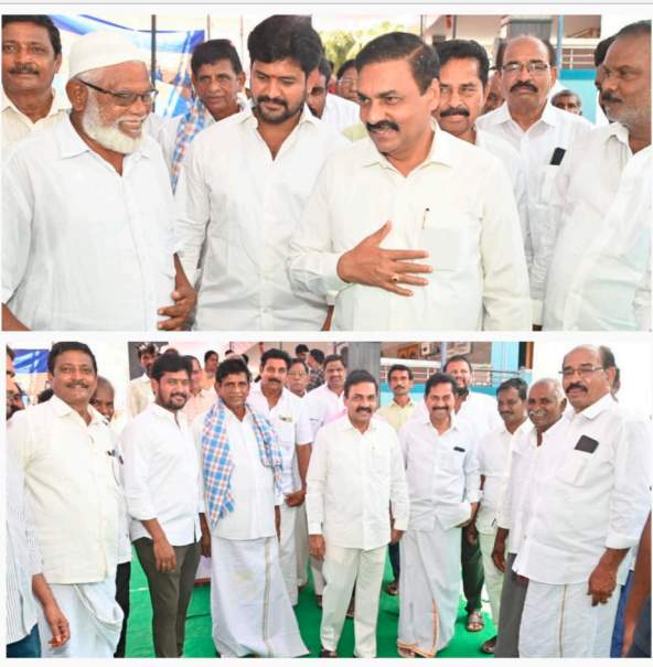
ఏడాది 24 వేల రూపాయల ఆర్థిక సహాయం అందించి ఆడుకున్నారు. చంద్రబాబు నాయుడు అన్ని వర్గాలను మోసం చేసినట్లు నేతనల్లను కూడా మోసం చేశాడు. సూపర్ సిక్స్ సూపర్ ఫ్లాస్ అయిన సందర్భంలో, సూపర్ సిక్స్ సూపర్ హిట్ అంటూ, చంద్రబాబు తనకు తానే ప్రకటించుకుంటున్నాడు. చంద్రబాబు ఎన్నికలకు ముందు ఇచ్చిన హామీలను బుట్ట దాఖలు చేసి, ప్రజలను