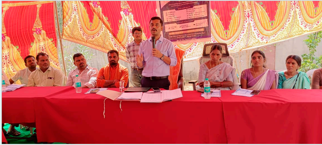
పథకం పై పథకాలపై అభ్యర్థులు అడిగిన సందేహాలను సబ్-కలెక్టర్ నివృత్తి చేశారు. ఈ పథకాల ప్రయోజనాలను పొందడానికి సంబంధిత అధికారులను ఎలా సంప్రదించాలో సబ్-కలెక్టర్ మార్గదర్శనం చేశారు

రెంజల్ మండలం దుప్పల్లి తెలంగాణ రాష్ట్ర గీతం జయ హే తెలంగాణ. సర్పంచ్ ద్వారా స్వాగత ప్రసంగం, పరిచయం. ముఖ్యమంత్రి సందేశం ఐ ఎన్ పి ఆర్గిజిఎం ద్వారా గురువారం ఉదయం అందించినది వాచనం. వివిధ శాఖల ఫైగ్షిప్ కార్యక్రమాలు మరియు సాధనపై సమాచారం. రైతు భరోసా, ఇతర పథకాల కింద లబ్ధిదారుల పేర్ల వాచనం లబ్ధిదారుల అభిప్రాయాలు, అనుభవాలు. ప్రజా ప్రతినిధుల సందేశం మరియు తదుపరి కార్యక్రమం. గ్రామ సమస్యలు మరియు పరిష్కారాలపై చర్చ. తీర్మానాలు, కార్యచరణ పాయింట్లు మరియు ముగింపు. బోధన్ సబ్-కలెక్టర్, రెంజల్ తహసీల్దార్, ఇతర అధికారులు ఈ కార్యక్రమంలో పాల్గొన్నారు. ఈ కార్యక్రమం సందర్భంగా సబ్-కలెక్టర్ క్రింది సంక్షేమ పథకాల గురించి వివరంగా వివరించారు: రైతు భరోసా, రైతు భీమా, కొత్త (రేషన్) కార్డులు, చేయూత పెన్షన్లు, ఇందిరమ్మ ఇళ్ల