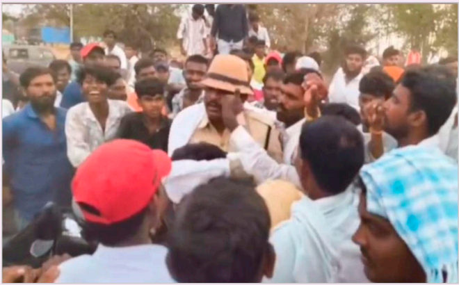
పోటీల్లో పాల్గొనడానికి వచ్చి కానిస్టేబుల్ దాడి లో