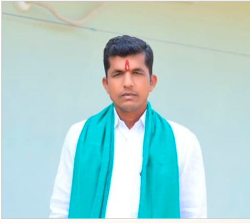
హీరోఇజం కాదని, ప్రజలకు ఇచ్చిన హామీలను అమలు చేయడం ద్వారా సమృథం సంపాదించాలని సూచించారు. ఇటువంటి దాడులకు తాము భయపడబోమని, దాడి చేసిన వారి భవితవ్యాన్ని కాల్మే నిర్ణయిస్తుందని హెచ్చరించారు.

పాల్పడుతోందని ఆరోపించారు. ప్రజలు అభివృద్ధి కోసం అధికారం ఇస్తే, దాడులు, కూల్చివేతలు చేయడం ప్రభుత్వ లక్ష్యమా అని ప్రశ్నించారు. ముఖ్యమంత్రి రేవంత్ రెడ్డి ప్రభుత్వం అభివృద్ధి కంటే ప్రతిపక్షాలపై దాడులకే ప్రాధాన్యత ఇస్తోందని విమర్శించారు. బీఆర్ఎస్ ప్రభుత్వం తిరిగి వస్తుందని, అప్పటి వరకు జరిగిన అన్యాయాలకు వడ్డీతో సహా సమాధానం ఇస్తామని హెచ్చరించారు. అభివృద్ధి చేయడం మాత్రమే కాకుండా అరాచక శక్తులను కట్టడి చేయడం కూడా తమకు తెలుసని స్పష్టం చేశారు. ప్రజల ఆస్తులపై పాకులే దాడులు చేయడం కంటే దారుణం మరొకటి లేదని, ఇది ప్రజాస్వామ్యంపై జరిగిన దాడి అని అన్నారు. కాంగ్రెస్ నాయకులు ఇచ్చిన హామీలను అమలు చేయలేక ప్రజల్లో విశ్వాసం కోల్పోతున్నారని, అందుకే ప్రతిపక్షాలపై దాడులకు దిగుతున్నారని విమర్శించారు. ప్రతిపక్షాలపై దాడులు చేయడం