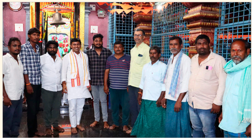
- ప్రత్యేక పూజల్లో పాల్గొన్న నాయకుడు