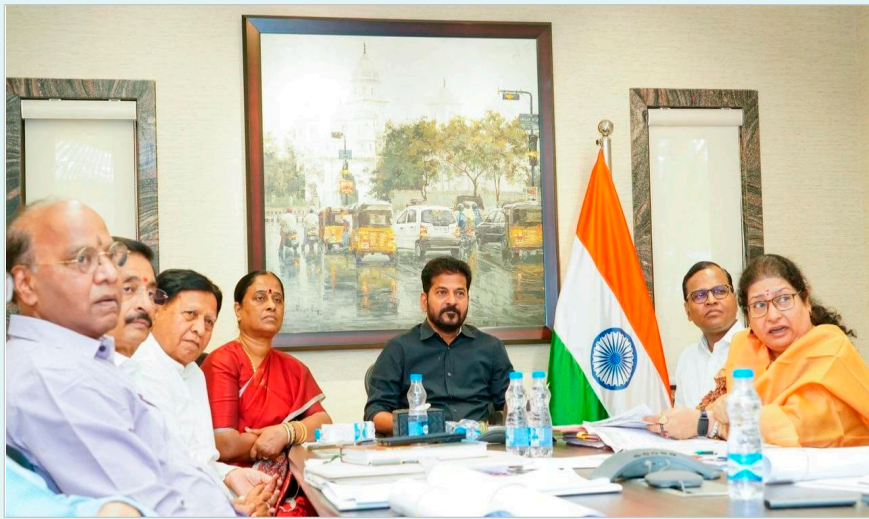
ఎలాంటి రాజకీయ కార్యకలాపాలు జరగకుండా నిబంధనలు ఉండాలని అధికారులకు స్పష్టంగా సూచించారు.

బాసర జ్ఞాన సరస్వతీ క్షేత్ర పునర్నిర్మాణానికి ముహూర్తం ఖరారైన నేపథ్యంలో సీఎం రేవంత్ రెడ్డి, ప్రభుత్వ ముఖ్య సలహాదారు ఎమ్మెల్యే సుదర్శన్ రెడ్డి అలయ అధికారులతో సమీక్ష నిర్వహించారు. అలయ మాస్టర్ ప్లాన్ పై వారికి కీలక సూచనలు చేశారు. రూ. 225 కోట్లతో చేపట్టనున్న ఈ పనులకు సీఎం ఈ నెల 6వ తేదీన శంకుస్థాపన చేయనున్నారు. ప్రతిపాదిత మాస్టర్ ప్లాన్లో పలు మార్పులు చేర్పులు సూచించారు. భక్తుల విశ్వాసాలను గౌరవిస్తూ, ఎక్కడా చిన్న పొరపాటు లేకుండా శాస్త్ర ప్రకారం అలయ అభివృద్ధి అద్భుతంగా ఉండేలా చర్యలు తీసుకోవాలని ఆదేశించారు. అలయ పరిసరాల్లో ఈవి వాహనాలను మాత్రమే వినియోగించేలా చర్యలు తీసుకోవాలని సూచించారు. అలయాలు పరిసరాల్లో