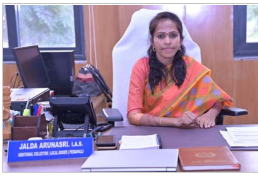
చేసుకుని భద్రపరిచి గణన అధికారి ఇంటికి వచ్చినప్పుడు చూపిస్తే వారు అప్రూవ్ చేస్తారని అన్నారు. అయితే ఒక కుటుంబానికి ఒకే మొబైల్ నంబర్ ఉపయోగించాలని తెలిపారు. దీంతో సమయం ఆదా అవుతుందని తెలిపారు. ఈ అవకాశాన్ని సద్వినియోగం చేసుకోవాలని కోరారు.

సెల్స్ ఎన్యూమరేషన్ ( హెచ్ ఎల్ ఓ ) లాగిన్ వద్ద తెలంగాణ ఎంపిక చేసి, క్యాప్చు ఎంటర్ చేసి వెరిఫై & ప్రాసీడ్ క్లిక్ చేస్తే వెబ్ కమ్ పేజీ తెరుచు కుంటుందని అన్నారు. ఈ పేజీలో కుటుంబ పెద్ద పేరు, మొబైల్ నంబర్ నమోదు చేయాలని తెలిపారు. ఆ తరువాత వచ్చిన ఓ టి పి ఎంటర్ చేసి మళ్ళీ వెరిఫై & ప్రాసీడ్ క్లిక్ 3వ యోలని తెలిపారు. ఆ తరువాత వచ్చిన భాష ను ఎంచుకొని జిల్లా, పట్టణం, పిన్ కోడ్ వివరాలు నమోదు చేయాలని కోరారు. మొబైల్ లో లాకేషన్ ఆన్ చేసి, ఎవరి ఇంటి వద్ద వారు రెడ్ మార్క్ సెట్ చేయాలని తెలిపారు. ఇళ్ల వివరాలకు సంబంధించిన 33 ప్రశ్నలకు సమాధానాలు ఇచ్చి, ప్రి వ్యూ ద్వారా చెక్ చేసి సబ్ మిట్ చేసిన తరువాత హెచ్ తో ప్రారంభమయ్యే 11 అంకెల సెల్స్ ఎన్యూమరేషన్ ఐ డి నెంబర్ వస్తుందని తెలిపారు. దాన్ని స్ట్రీన్షాట్ తీసుకొని లేదా నమోదు