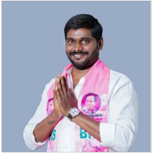
రేవంత్ సర్కార్ కుట్రలు చేస్తున్నదని ఆరోపించారు.

కూకట్ పల్లి : ప్రైవేట్ యూనివర్సిటీల లబ్ధి కోసమే రేవంత్ సర్కార్ జీవో 7ను తీసుకొచ్చిందని బిఆర్ఎస్ రాష్ట్ర ప్రధాన కార్యదర్శి ఆశ్వంత్ కుమార్ ఒక ప్రకటనలో ఆరోపించారు. యూనివర్సిటీల గుర్తింపుతో (అఫిలియేషన్) నడిచే కాలేజీలు మూతపడటమే లక్ష్యంగా ప్రభుత్వం ఈ నిర్ణయం తీసుకున్నదని పేర్కొన్నారు. ఎస్సీ, ఎస్టీ బీసీ, మైనారిటీ వర్గాలతోపాటు దివ్యాంగులకు ఉన్నత విద్యను దూరం చేయాలని