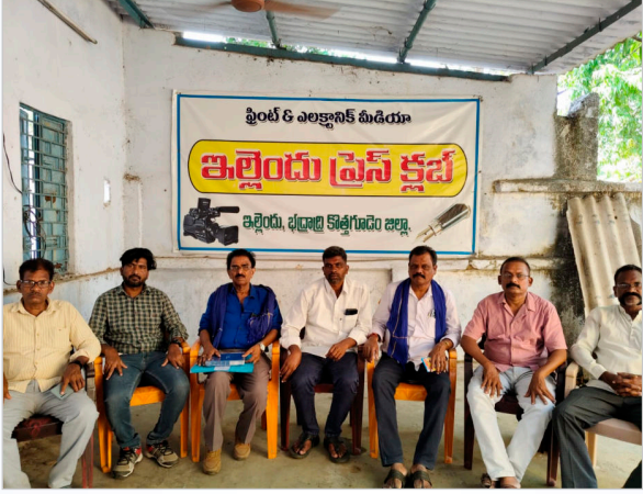
గడప తొక్కినా, అధికారుల నుంచి ఆశించిన స్పందన కరువవ్వడం గమనార్హం. గత కొన్ని నెలలుగా

బాధితుడు తన గోడును వెళ్లబోసుకుంటూ పోలీసుల