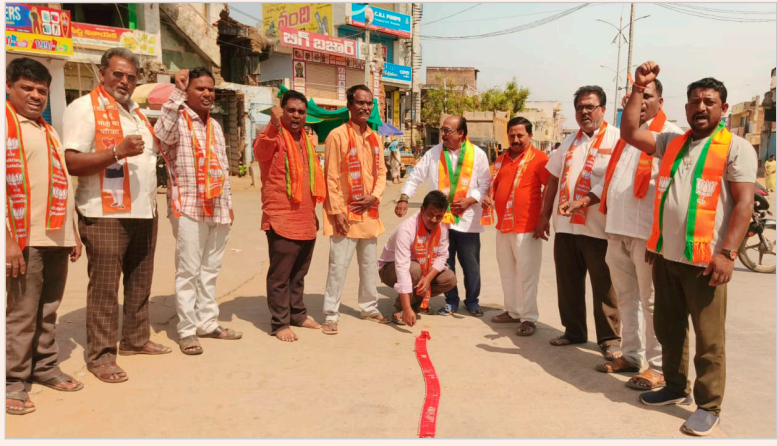
ఎల్లారెడ్డి, మే -5(జన సంఘర్షణ)

మూడు రాష్ట్రాల ఎన్నికల్లో బీజేపీ పార్టీ భారీ విజయంతో ప్రభుత్వాన్ని ఏర్పాటు చేసిన సందర్భంగా ఎల్లారెడ్డి కేంద్రంలో మంగళవారం బీజేపీ నాయకులు గెలుపు సంబరాలు నిర్వహించారు.