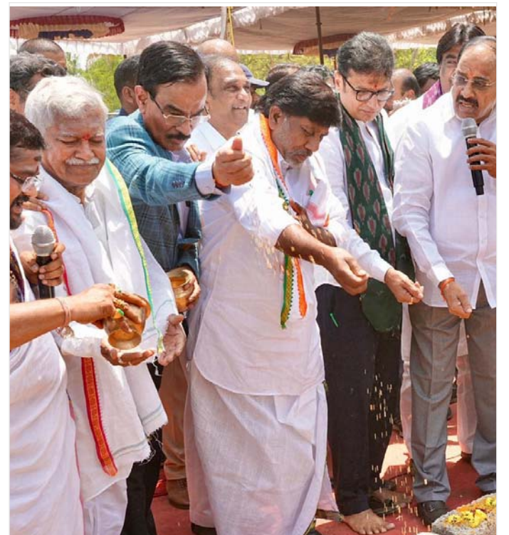
తప్పుబట్టారు. తెలంగాణ రైతులు పండించిన పంటను కేంద్రం నిర్ణయించిన కనీస మద్దతు ధర ప్రకారమే రాష్ట్ర ప్రభుత్వం కొనుగోలు

రాజన్న సిరిసిల్ల జిల్లా గంభీరావుపేటలో బయోస్ట్రాటమ్ టెక్నాలజీస్ ఆధ్వర్యంలో ఏర్పాటు చేయనున్న కంప్లెక్స్ బయో గ్యాస్ ప్లాంట్ నిర్మాణానికి ఉప ముఖ్యమంత్రి భట్టి విక్రమార్క భూమి పూజ చేశారు. ఈ కార్యక్రమంలో మంత్రులు దుద్దిళ్ల శ్రీధర్ బాబు, తుమ్మల నాగేశ్వర్ రావు మరియు పొన్నం ప్రభాకర్ పాల్గొన్నారు. ఈ సందర్భంగా ఉప ముఖ్యమంత్రి భట్టి విక్రమార్క మాట్లాడుతూ, ప్రధానమంత్రి నరేంద్ర మోదీ తెలంగాణ పర్యటన నేపథ్యంలో, ఉమ్మడి రాష్ట్రంలో కాంగ్రెస్ హయాంలో రూపొందించిన డాక్టర్ బి.ఆర్. అంబేద్కర్ ప్రాణహిత-చేవెళ్ల ప్రాజెక్టును తక్షణమే జాతీయ ప్రాజెక్టుగా ప్రకటించాలని డిమాండ్ చేశారు. రాష్ట్ర విభజన చట్టం ప్రకారం తెలంగాణలోని ఒక ప్రధాన సాగునీటి ప్రాజెక్టుకు జాతీయ హోదా కల్పిస్తామని నాటి కేంద్ర ప్రభుత్వం ఇచ్చిన హామీని ప్రస్తుత ప్రభుత్వం నెరవేర్చాల్సిన బాధ్యత ఉందని ఆయన గుర్తు చేశారు. 2014 తర్వాత బీజేపీ ప్రభుత్వం ఆంధ్రప్రదేశ్లోని పోలవరం ప్రాజెక్టును జాతీయ ప్రాజెక్టుగా గుర్తించినప్పటికీ, తెలంగాణలో ఏ ఒక్క ప్రాజెక్టుకు కూడా ఆ హోదా కల్పించకపోవడం రాష్ట్రం పట్ల కేంద్రం చూపిస్తున్న వివక్షకు నిదర్శనమని భట్టి విక్రమార్క ఆరోపించారు. ధాన్యం కొనుగోలు మరియు రైతు సంక్షేమం విషయంలో కేంద్ర ప్రభుత్వం అనుసరిస్తున్న తీరును కూడా ఆయన తీవ్రంగా