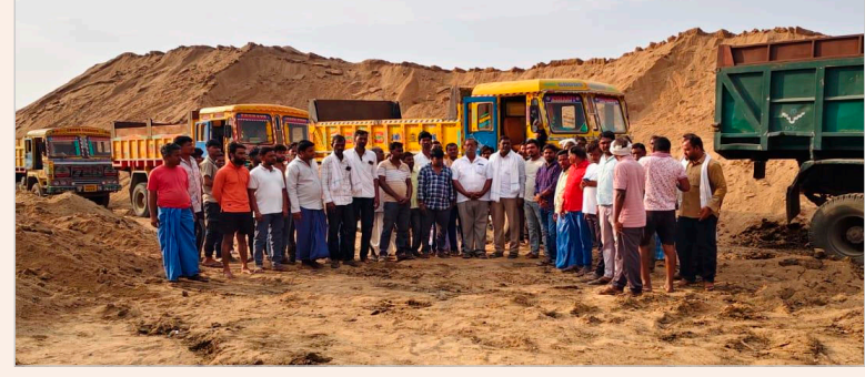
పోతంగల్/ మే 6/(జన సంఘర్షణ)