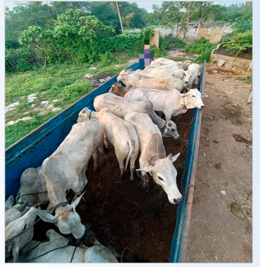
2025 సంవత్సరం బక్రీద్ కి ఒక రోజు ముందు

చేసింది. ప్రతి ఏటా పీస్ మీటింగ్లో గోవధ చేయబోమని హామీ ఇవ్వడం, తీరా సమయం వచ్చాక ఆ మాట తప్పడం ఒక అలవాటుగా మారిందని ప్రతినిధులు ఆవేదన వ్యక్తం చేశారు. కేవలం మాటల గారడీతో పట్టుం గడుపుకోవడం కాకుండా, గోవధ నిషేధ చట్టాన్ని తూచా తప్పుకుండా అమలు చేసే ధైర్యం పోలీస్ శాఖకు ఉండా అని వారు ప్రశ్నించారు. చట్టాన్ని గౌరవించని పక్షంలో చర్చలకు అర్థం లేదని వారు తేల్చి చెప్పారు. ముఖ్యంగా, గోవధ నిషేధ చట్టం-1977