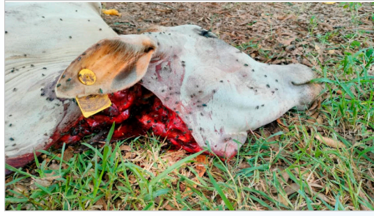
2024 సంవత్సరం బక్రీద్ రోజు

శాంతి కమిటీ సమావేశాలు కేవలం ఫోటోలకు, పైకే పరిమితమవుతున్నాయా? క్షేత్రస్థాయిలో చట్టం అమలు కానప్పుడు ఈ తూతూమంత్రపు చర్చల వల్ల ప్రయోజనం ఏమిటి? ఇవే ఇప్పుడు ఇల్లందులో సెగలు రేపుతున్న ప్రశ్నలు. బక్రీద్ వందగ వేళ పోలీస్ శాఖ నిర్వహించిన పీస్ మీటింగును హిందూ సంఘాలు ముక్కకంఠంతో బహిష్కరించి, తమ నిరసనను గళమెత్తాయి. ఇది కేవలం ఒక సమావేశాన్ని వదిలి వెళ్లడం కాదు, వ్యవస్థీకృత వైఖరిపై వినిపిన సవాల్. పోలీస్ యంత్రాంగం పై అధికారులకు నివేదికలు పంపుకోవడానికి, రికార్డుల్లో 'అంతా సవ్యంగా ఉంది' అని చూపించుకోవడానికి ఈ సమావేశాలను ఒక అలంకారప్రాయంగా వాడుకుంటున్నారని హిందూ సంఘాలు ఆరోపించాయి. శాంతి అనేది రెండు వర్గాల మధ్య సమానంగా ఉండాలి కానీ, ఒక వర్గానికి మినహాయింపులు ఇస్తూ, మరొక వర్గాన్ని నియంత్రించేలా ఉండకూడదని వారు ఘాటంగా విమర్శించారు.