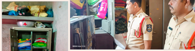
ఎల్లారెడ్డి, మే -11(జన సంఘర్షణ)