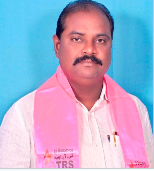
కొత్తగూడెం మే 11 (జన సంఘర్షణ)