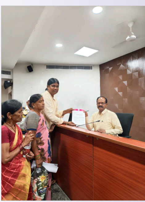
జవాబుదారీతనం లేకపోవడం వల్లే ఇలాంటి వారు రెచ్చిపోతున్నారని దుయ్యబట్టారు.