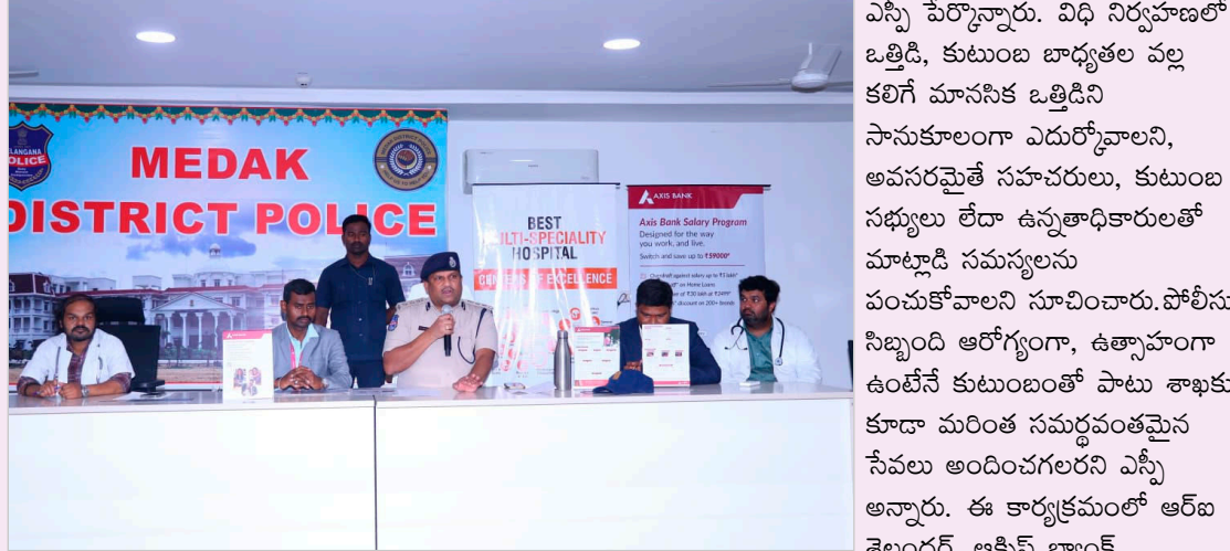
ఉండాలని, క్రమం తప్పకుండా ఆరోగ్య పరీక్షలు చేయించుకోవాలని తెలిపారు. శారీరక ఆరోగ్యంతో పాటు మానసిక ఆరోగ్యం కూడా ఎంతో ముఖ్యమని ప్రతినిధులు, యశోద హాస్పిటల్ వైద్యులు, పోలీసు సిబ్బంది పాల్గొన్నారు.